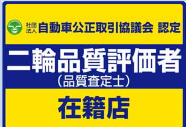
【品質評価者在籍店ステッカー】

なお、「品質評価実施店」のPRにつきましては、今後、「品質評価者在籍店」のPRに変わります。