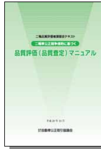
品質評価（品質査定）マニュアル