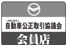
会員店ステッカー(四輪)